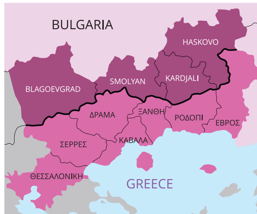
* Διασυνοριακή Περιοχή: Περιφέρεια Ανατολικής Μακεδονίας και Θράκης, Περιφέρεια Κεντρικής Μακεδονίας (Ελλάδα), επαρχίες Blagoevgrad, Smolyan, Kardjali και Haskovo (Βουλγαρία).