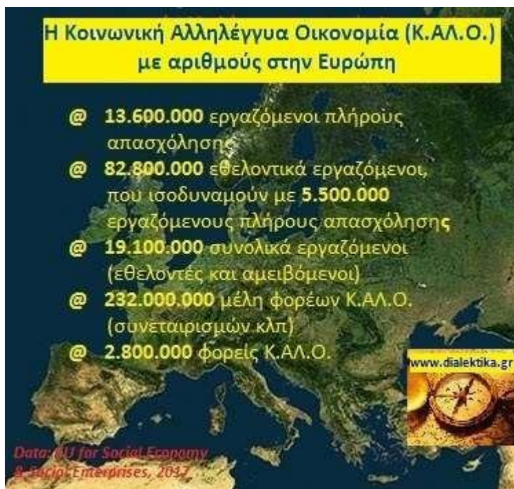
Η Κοινωνική Αλληλέγγυα Οικονομία στην Ευρώπη

Η γενική εικόνα ποικίλλει μεταξύ των χωρών της ΕΕ. Ενώ η απασχόληση στην κοινωνική οικονομία αντιπροσωπεύει μεταξύ 9% και 10% του ενεργού πληθυσμού σε χώρες όπως το Βέλγιο, η Ιταλία, το Λουξεμβούργο, η Γαλλία και οι Κάτω Χώρες, στα νέα κράτη μέλη της ΕΕ