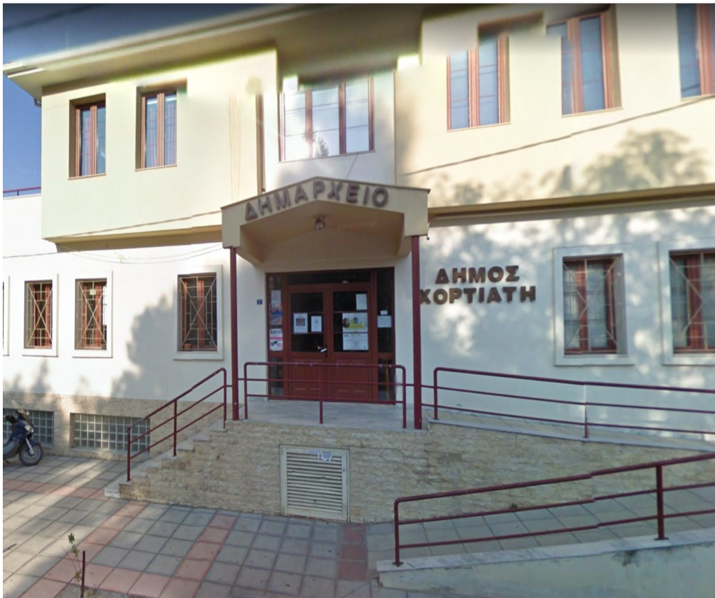
Εικόνα 2: Δημαρχείο Ασβεστοχωρίου

Το γραφείο υποστήριξης αναμένεται να λειτουργεί εβδομαδιαία στις ώρες λειτουργίας υπηρεσιών του δήμου ενώ ανάλογα με το ενδιαφέρον για συναντήσεις υπάρχει το ενδεχόμενο να λειτουργεί και απογευματινές ώρες με σκοπό να εξυπηρετούνται και ενδιαφερόμενοι που διαθέτουν χρόνο μόνο τα απογεύματα. Επίσης θα δίνεται η δυνατότητα εξυπηρέτησης, πληροφόρησης ενδιαφερομένων κατόπιν ραντεβού.