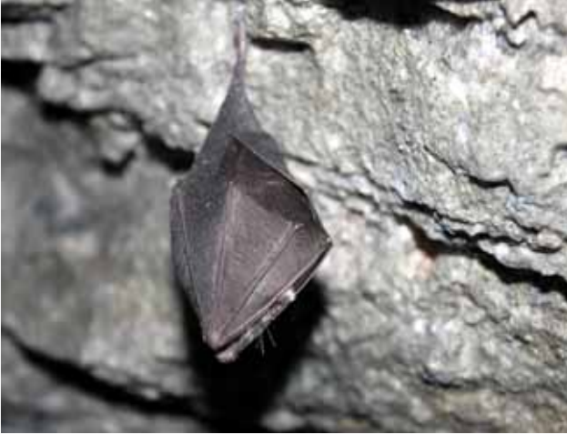
Μικρορινόλοφος (Rhinolophus hipposideros)

9 βαθμών. Διαχειμάζει μεμονωμένα ή σε αραιές ομάδες, με αποστάσεις μεταξύ των νυχτερίδων έως 50 cm. Σταθερό είδος - Η απόσταση μεταξύ χειμερινών και καλοκαιρινών καταφυγίων συνήθως δεν υπερβαίνει τα 15 km. Θεωρείται παγκοσμίως απειλούμενο είδος.