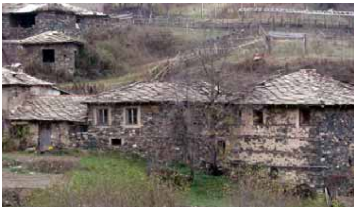
Τα παλιά και ακατοίκητα σπίτια παρέχουν καταφύγιο σε πολλά είδη νυκτερίδων, κυρίως από την οικογένεια των ρινόλοφων (Rhinolophidae)

Πρόγραμμα, συγχρηματοδοτούμενο από την Ευρωπαϊκή Ένωση και τα εθνικά ταμεία των συμμετεχουσών χωρών. Το περιεχόμενο της παρούσας έκδοσης αποτελεί αποκλειστική ευθύνη των εταιρών του προγράμματος και δεν μπορεί σε καμία περίπτωση να αντικατοπτρίζει τις απόψεις της Ευρωπαϊκής Ένωσης, των συμμετεχουσών χωρών, της Διαχειριστικής Αρχής και της Κοινής Γραμματείας.