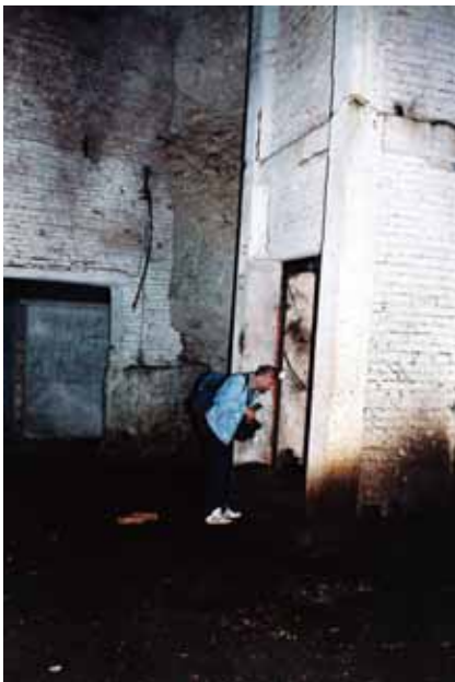
Εξέταση φρεατίου ανεκλυστήρα, το οποίο κατοικείται από αποικία αναπαραγωγής Myotis myotis

Πρόγραμμα, συγχρηματοδοτούμενο από την Ευρωπαϊκή Ένωση και τα εθνικά ταμεία των συμμετεχουσών χωρών. Το περιεχόμενο της παρούσας έκδοσης αποτελεί αποκλειστική ευθύνη των εταίρων του προγράμματος και δεν μπορεί σε καμία περίπτωση να αντικατοπτρίζει τις απόψεις της Ευρωπαϊκής Ένωσης, των συμμετεχουσών χωρών, της Διαχειριστικής Αρχής και της Κοινής Γραμματείας.