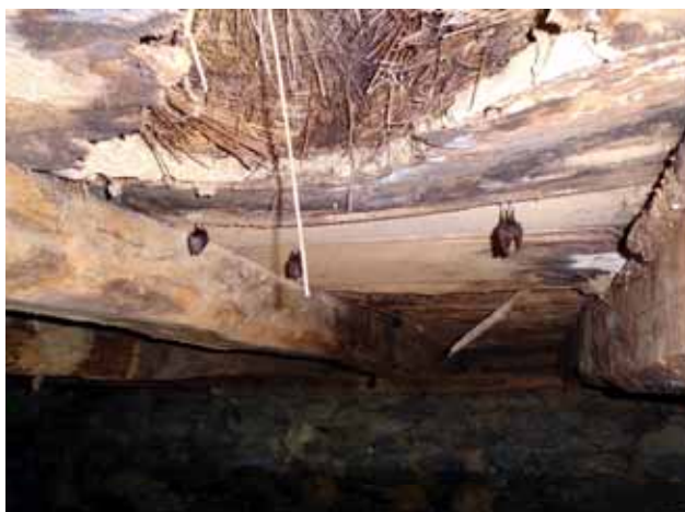
Μικρορινόλοφοι ( Rhinolophus hipposideros ) σε οροφή εγκαταλελειμμένης κατοικίας

Τα καταφύγια των νυχτερίδων ποικίλουν ανάλογα με το είδος των κτιρίων. Για τον λόγο αυτό, οι εγκατεστημένες σε αυτά νυχτερίδες δεν είναι πάντα δυνατόν να παρατηρηθούν. Το πιο εύκολο για ταυτοποίηση είναι το είδος των ρινόλοφων νυχτερίδων, διότι αυτές συνήθως κατοικούν σε προσιτούς για παρατήρηση χώρους και διακρίνονται εύκολα λόγω μεγέθους. Οι ωτονυχτερίδες ορισμένες φορές παρατηρούνται σε ευδιάκριτα σημεία ξύλινων κατασκευών στεγών.