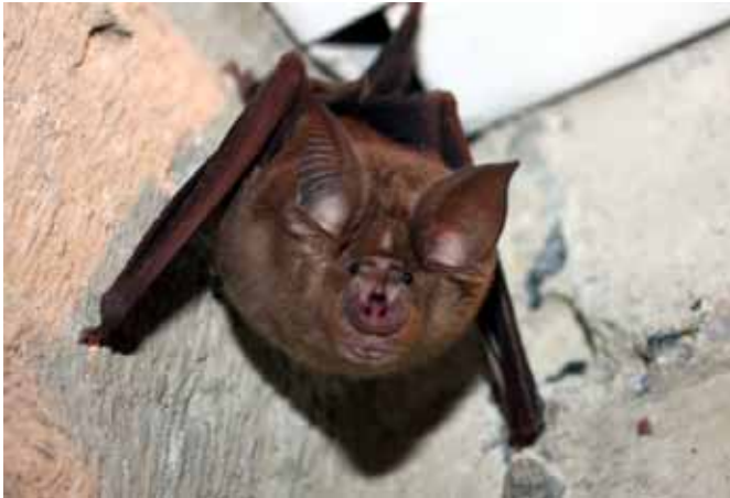
Τρανορινόλοφος (Rhinolophus ferrumequinum)

Συχνά ξυπνά και αλλάζει τη θέση της το καταφύγιο. Μερικές φορές το χειμώνα με ήπιο καιρό, τρέφεται κοντά στην είσοδο του σπηλαίου. Οι εποχιακές μετακινήσεις μεταξύ καλοκαιρινών και χειμερινών καταφυγίων δεν υπερβαίνουν συνήθως τα 50 χιλιόμετρα, αλλά έχουν γίνει επίσης γνωστές και μετακινήσεις 100 χιλιομέτρων. Οι περίοδοι ζευγαρώματος είναι το φθινόπωρο και την άνοιξη. Η εγκυμοσύνη διαρκεί 10-11 εβδομάδες. Τον Μάιο - Ιούνιο, τα θηλυκά συγκεντρώνονται σε αναπαραγωγικές αποικίες που αριθμούν μέχρι 200 (σπάνια μέχρι 600) άτομα, όπου γεννούν (Ιούνιος - αρχές Ιουλίου) και φροντίζουν τα μικρά τους. Συνήθως γεννιέται ένα γυμνό και τυφλό μικρό (σπάνια δύο). Τα μάτια των μικρών ανοίγουν μία εβδομάδα μετά. Αρχίζουν να πετούν μετά από 3-4 εβδομάδες και μετά από 6 έως 8 εβδομάδες περνούν στην ανεξάρτητη ζωή. Οι αποικίες αναπαραγωγής διαλύονται στα τέλη Αυγούστου - αρχές Σεπτεμβρίου. Για πρώτη φορά γεννούν στο 3 ο έτος της ηλικίας τους, αλλά κάποια άτομα στο 9 ο . Τα θηλυκά δεν συμμετέχουν κάθε χρόνο στην αναπαραγωγή. Τα αρσενικά είναι ώριμα για αναπαραγωγή στο τέλος του 2 ου έτους. Η διάρκεια ζωής τους είναι έως 30 χρόνια περίπου.