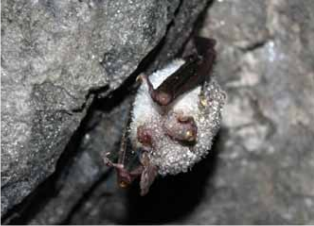
Τρανομωτίδα ( Myotis myotis ), πλήρης σταγονιδίων συμπυκνωμένης υγρασίας

Όταν οι εργασίες επισκευής γίνονται κατά τη διάρκεια αυτής της περιόδου, οι νυχτερίδες κυριολεκτικά χτίζονται ζωντανές ή συνθλίβονται κατά τη διάρκεια των εργασιών, δεδομένου ότι δεν είναι σε θέση να εγκαταλείψουν έγκαιρα τα καταφύγια τους.