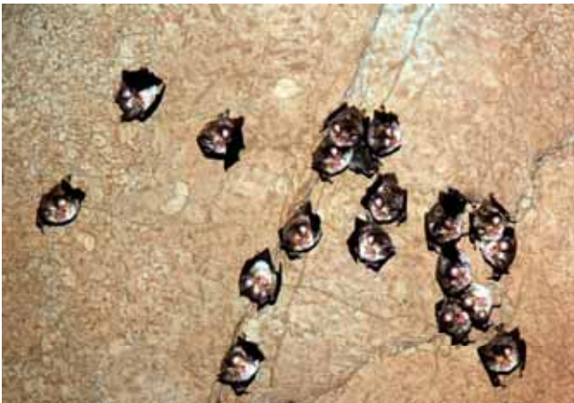
Μικρή αποικία Μεσορινόλοφου ( Rhinolophus euryale )

γεννούν συνήθως μετά τα μέσα Ιουνίου μέχρι περίπου τα μέσα Ιουλίου. Ο αριθμός των ατόμων ανά αποικία αναπαραγωγής στη χώρα μας είναι συνήθως από 100 έως 600. Πολύ πιο κοινωνικός από τον τρανορινόλοφο και το μικρορινόλοφο. Μερικές φορές δημιουργεί ξεχωριστές αποικίες σε σπήλαια 50-300 ατόμων. Συχνά συνυπάρχει με άλλα είδη νυχτερίδων σπηλαιών. Τον χειμώνα συναντάται σε μικτές αποικίες, συνήθως με τον Ρινόλοφο του Blasius και τον Ρινόλοφο του Mehely και πιο σπάνια με το Τρανορινόλοφο. Συνήθως εγκαθίστανται στα θερμότερα μέρη (10-13°C) των σπηλαίων. Στη χώρα μας εκτελεί εποχιακές μεταναστεύσεις μεταξύ θερινών και χειμερινών καταφυγίων από 10 έως 60 km. Οι μεγαλύτερες καταγεγραμμένες μεταναστεύσεις δεν υπερβαίνουν τα 140 km. Δεν υπάρχουν συγκεκριμένα στοιχεία σχετικά με τη σύνθεση της τροφής, αλλά πιθανώς αποτελείται από μικρά έντομα (μύγες, κουνούπια, νυχτοπεταλούδες). Στη Βουλγαρία έχουν καταγραφεί αποικίες αναπαραγωγής, που αριθμούν συνήθως από μερικές δεκάδες έως περίπου 2000 άτομα. Σε σπήλαιο της Βόρειας Βουλγαρίας έχει καταγραφεί η μεγαλύτερη αποικία αναπαραγωγής του είδους, που αριθμεί 20 000 άτομα. Γεννά από ένα μικρό στα τέλη Ιουνίου - αρχές Ιουλίου.