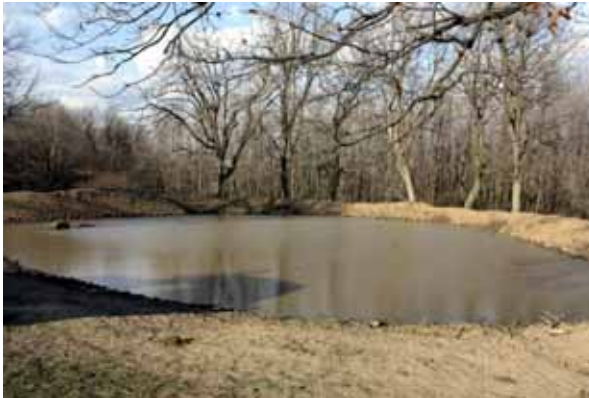
Οι κυνηγητικές περιοχές σχεδόν όλων των ειδών του γένους Pipistrellus συνδέονται με υδάτινες επιφάνειες.

Συχνά απαντώμενα είναι τα είδη Νανονυχτερίδα και Μικρονυχτερίδα ( Pipistrellus pipistrellus , Pipistrellus pygmaeus ), τα οποία σιτίζονται σε ευρύ φάσμα ενδιαιτημάτων, συμπεριλαμβανομένων δασών, βοσκοτόπων, γεωργικών, περιαστικών και αστικών περιοχών. Επιλέγουν για στέγαση κουφάλες δένδρων, ανοίγματα κάτω από χαλαρούς φλοιούς και για τη χειμερία νάρκη ρωγμές δένδρων. Αυτά τα δύο είδη προτιμούν επίσης τους τόπους σίτισης με γραμμική βλάστηση, όπως θαμνοσειρές, οι οποίοι μπορούν να βοηθήσουν στην πλοήγηση ή τη σίτισή τους ή να παρέχουν προστασία από αρπακτικά. Οι τόποι σίτισης της Νανονυχτερίδας βρίσκονται συχνά πλησίον υδάτων και παρυφών δασών, καθώς αυτά τα ενδιαιτήματα διασφαλίζουν την κατάλληλη λεία, κυρίως λεπιδόπτερα έντομα.