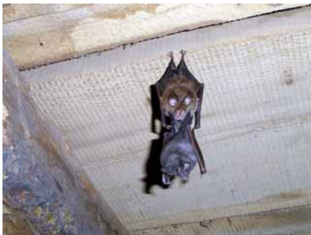
Μικρορινόλοφος (Rhinolophus hipposideros) - μητέρα με νεογνό

Μια άλλη απειλή για τις νυχτερίδες στην πόλη είναι τα κατοικίδια ζώα, στα οποία αρέσει πολύ "να παίζουν" με τα ιπτάμενα θηλαστικά, χωρίς να τα σκοτώνουν. Συχνότατα όμως τα τραυματίζουν, λόγω της ευάλωτης δομής τους.