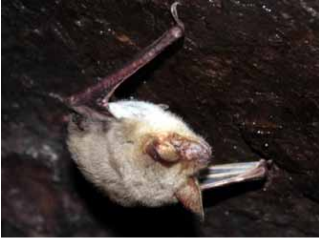
Μικρομωτίδα (Myotis blythii)

Σύμφωνα με στοιχεία από νέες γενετικές μελέτες, είναι γνωστό ότι τα δύο δίδυμα είδη είναι δυνατόν να υβριδοποιηθούν, γεγονός που πιθανώς επηρεάζει λιγότερο από το 5% των πληθυσμών τους στη Βουλγαρία.