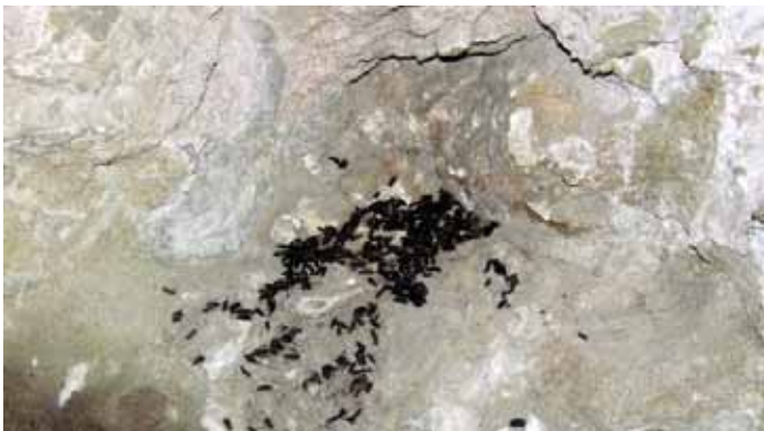
Συχνά, κατά τη διάρκεια ελέγχου κτισμάτων, ανευρίσκονται ίχνη παρουσίας νυχτερίδων - γκουανό