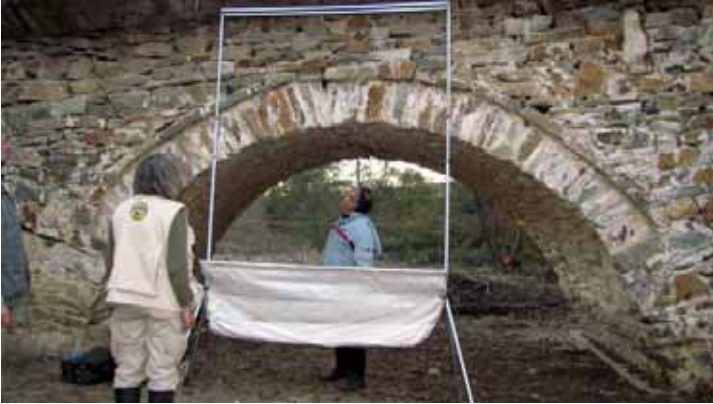
Η παγίδα του Tuttle

Η παγίδα για νυχτερίδες που ζουν σε κουφάλες δέντρων αποτελείται από κανικό πλαστικό σωλήνα, λεπτούς δακτυλίους μεταξύ των οποίων τεντώνεται λεπτή κλωστή και πλαστική "προβοσκίδα". Τοποθετείται στην είσοδο της κουφάλας/της οπής, οπότε οι νυχτερίδες βγαίνοντας χτυπούν επάνω στην κλωστή, στη συνέχεια πέφτουν μέσα στον σωλήνα κι από εκεί, μέσω της "προβοσκίδας", πέφτουν εντός βαμβακερής σακούλας.