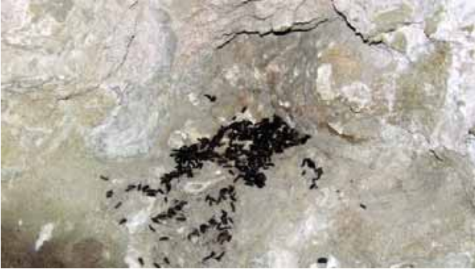
Συχνά, κατά τη διάρκεια ελέγχου κτισμάτων, ανευρίσκονται ίχνη παρουσίας νυχτερίδων - γκουανό