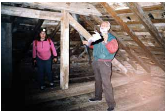
Εξέταση οροφής εγκαταλελειμμένης οικίας η οποία κατοικείται από Τρανορινόλοφους ( Rhinolophus ferrumequinum )