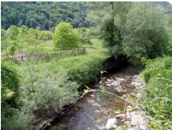
Τα φυσικά οικοσυστήματα σε γειτνίαση με οικισμούς αποτελούν εννοϊκά ενδιαιτήματα και για τα συνανθρωπικά είδη νυχτερίδων