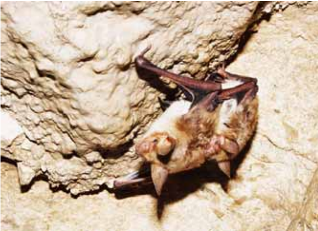
Ζευγάριωμα Τρανομωτίδων (Myotis myotis)

σε οροφές εκκλησιών, ιδιαίτερα σε μικρότερες κατοικημένες περιοχές και σπανιότερα σε πόλεις. Σε μεμονωμένες περιπτώσεις έχει παρατηρηθεί και εντός ρωγμών προκατασκευασμένων κτιρίων. Διαχειμάζει σε υπόγειους χώρους (σπήλαια, ορυχεία, υπόγειους αποθηκευτικούς χώρους). Διαχειμάζει μεμονωμένα ή σχηματίζει μεγάλες αποικίες αρκετών χιλιάδων ατόμων. Εκτελεί εποχιακές μεταναστεύσεις μεταξύ καλοκαιρινών και χειμερινών καταφυγίων, φθάνοντας συχνά σε αποστάσεις άνω των 100 χλμ.