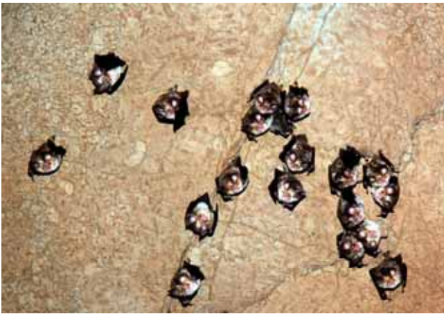
Μικρή αποικία Μεσορινόλοφου ( Rhinolophus euryale )

γεννούν συνήθως μετά τα μέσα Ιουνίου μέχρι περίπου τα μέσα Ιουλίου. Ο αριθμός των ατόμων ανά αποικία αναπαραγωγής στη χώρα μας είναι συνήθως από 100 έως 600. Πολύ πιο κοινωνικός από τον τρανορινόλοφο και το μικρορινόλοφο. Μερικές φορές δημιουργεί ξεχωριστές αποικίες σε σπήλαια 50-300 ατόμων. Συχνά συνυπάρχει με άλλα είδη νυχτερίδων σπηλαίων. Τον χειμώνα συναντάται σε μικτές αποικίες, συνήθως με τον Ρινόλοφο του Blasius και τον Ρινόλοφο του Mehely και πιο σπάνια με το Τρανορινόλοφο. Συνήθως εγκαθίστανται στα θερμότερα μέρη (10-13°C) των σπηλαίων. Στη χώρα μας εκτελεί εποχιακές μεταναστεύσεις μεταξύ θερρινών και χειμερινών καταφυγίων από 10 έως 60 km. Οι μεγαλύτερες καταγεγραμμένες μεταναστεύσεις δεν υπερβαίνουν τα 140 km. Δεν υπάρχουν συγκεκριμένα στοιχεία σχετικά με τη σύνθεση της τροφής, αλλά πιθανώς αποτελείται από μικρά έντομα (μύγες, κουνούπια, νυχτοπεταλούδες). Στη Βουλγαρία έχουν καταγραφεί αποικίες αναπαραγωγής, που αριθμούν συνήθως από μερικές δεκάδες έως περίπου 2000 άτομα. Σε σπήλαιο της Βόρειας Βουλγαρίας έχει καταγραφεί η μεγαλύτερη αποικία αναπαραγωγής του είδους, που αριθμεί 20 000 άτομα. Γεννά από ένα μικρό στα τέλη Ιουνίου - αρχές Ιουλίου.