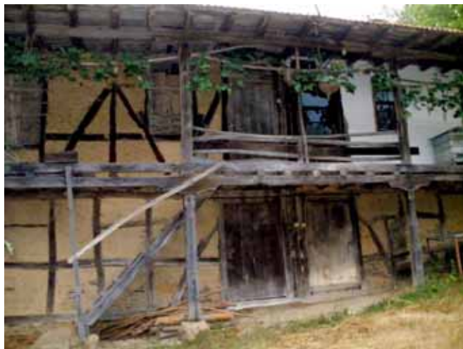
Ανοίγματα κάτω από τη στέγη παλαιού σπιτιού - κατοικούνται συχνά από τα είδη των γενών Pipistrellus και Nyctalus

Τα περισσότερα είδη στο αστικό περιβάλλον απαντώνται στους χώρους μεταξύ των πολυκατοικιών, όπου κυριαρχεί δασώδης βλάστηση και σε δασώδη πάρκα, σε σπίτια με αυλές, πάνω από ποτάμια με δασωμένες όχθες, σε ορεινές και πεδινές περιοχές, σε όχθες ποταμών με υψηλή βλάστηση σε ορεινές περιοχές και σε κανάλια σε πεδινές περιοχές.