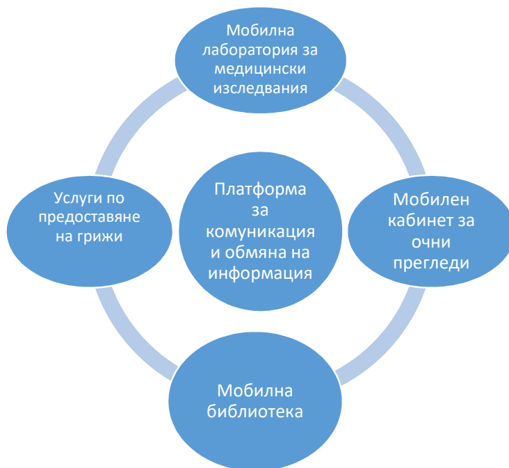
Фигура 4. Клъстер: Грижи за хората