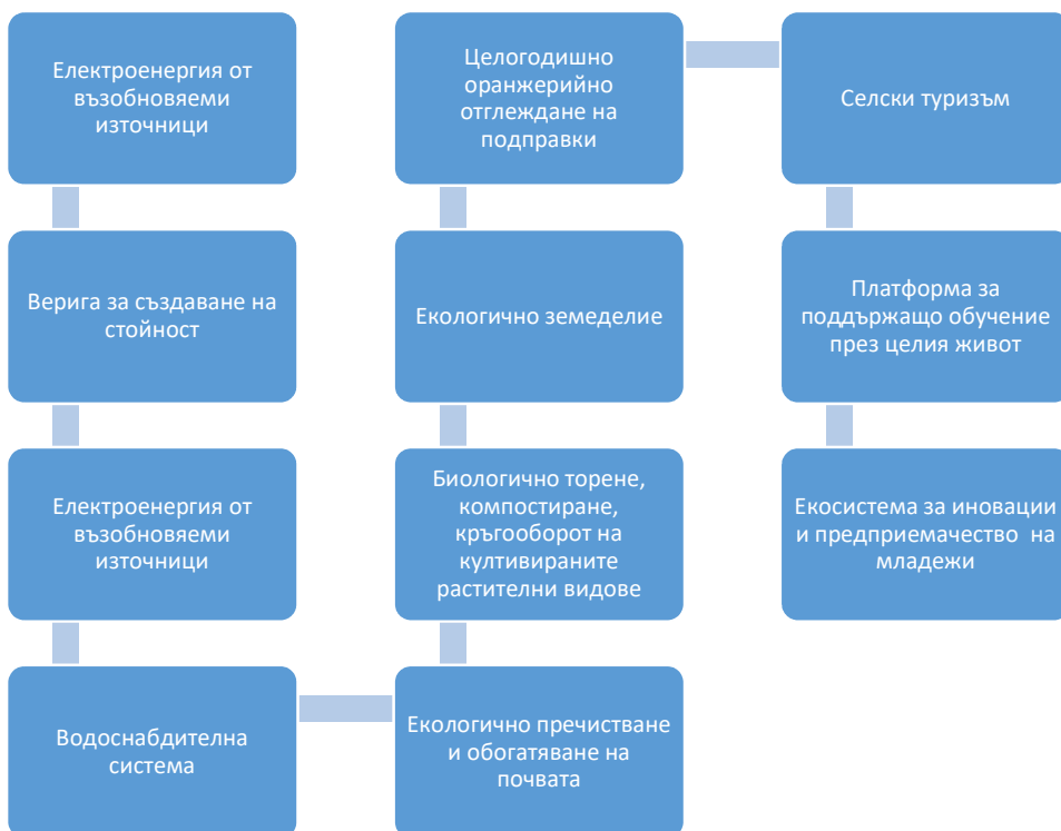
Фигура 1.2. Верига за създаване на стойност: Електроенергия от възобновяеми източници