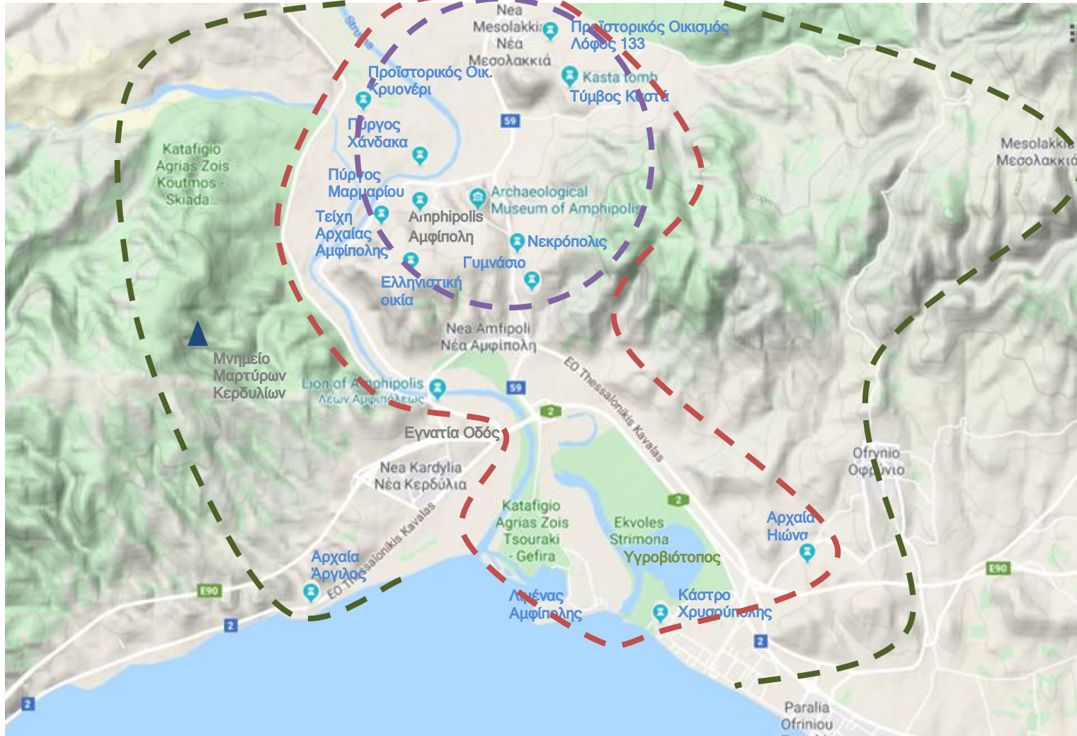
Χάρτης 2 – Αρχαιολογικό Πάρκο Αμφίπολης – πρόταση