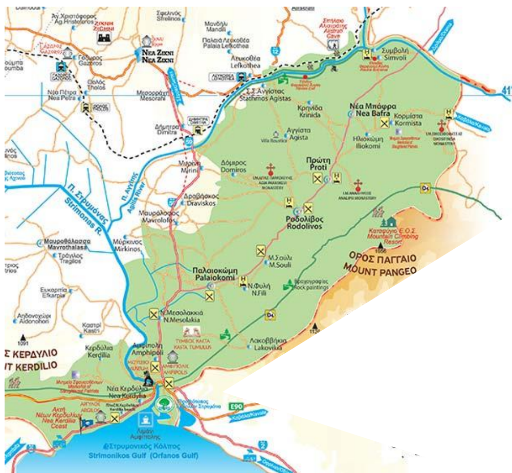
Χάρτης 4 – Σημεία τουριστικού ενδιαφέροντος Δήμου Αμφίπολης

Ο Δήμος Αμφίπολης, ενώ διαθέτει πλούσιους πολιτιστικούς και φυσικούς πόρους (αρχαιολογικοί χώροι – μνημεία, παραδοσιακά χωριά, Παγγαίο) και γειτνιάζει με την «αναπτυγμένη» παραθαλάσσια – παραθεριστική ζώνη του Στρυμονικού κόλπου (Ασπροβάλτα – Κερδύλια – παραλία Οφρυνίου / Τούζλας), ο ίδιος είναι ουσιαστικά μια σχετικά «παρθένα» τουριστική περιοχή.