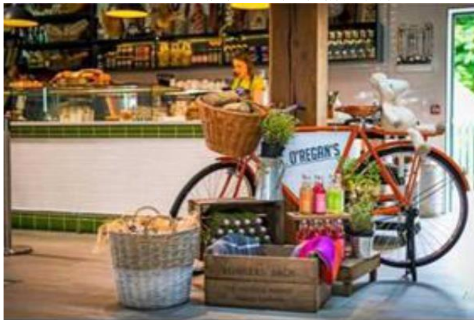
Φωτογραφία από την περιοχή για φαγητό

Στα περίχωρα του κάστρου, έχουν αναπτυχθεί μέρη για εμπορικές δραστηριότητες, όπως: καταστήματα σουβενίρ · έκθεση Ιρλανδικών καλλιτεχνών · περιοχές για φαγητό · καταστήματα, τα οποία πωλούν τοπικά προϊόντα · εργαστήρια παραγωγής και επιδείξεων · εσωτερική μεταφορά με άλογα.